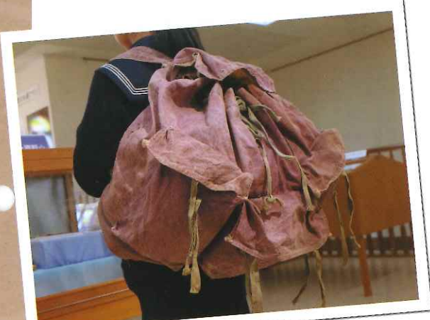
背負うとかなりの大きさだ

いま振り返ると、このリュックは佐世保市の浦頭港から上陸した後も、いつも私のそばに居てくれました。リュックが言葉を発するのなら、どのような話を私にしてくれるだろうかと、考えたことがあります。