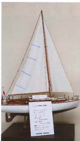
サナトス号の模型 (能古博物館)

〔筆者注〕文中敬称略。参考資料11福岡県セーリング連盟六十年史（2008年刊）、日本ヨット史（城崎謙太郎著・舵社刊）、九大ヨット部五十年史（1977年刊）、1964年江ノ島の記録・黄金の舵附録（2013年刊）、犬と私の太平洋（牛島龍介著・朝日新聞社刊）。