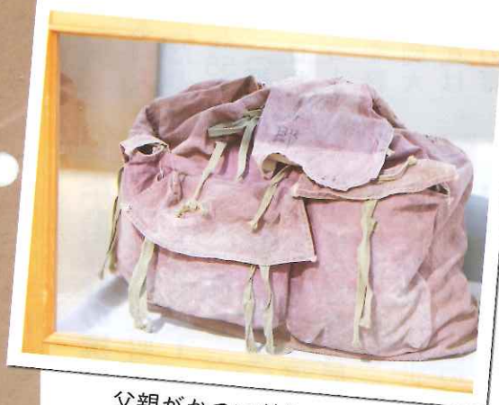
父親がかついだリュック (別館2階に展示)

我が家はリュックを2個用意しました。「灰汁まき」はいま市販されているような上品な「ちまき」とは違い、濃い茶色で、かなり癖のある香りがする食べ物でした。各人がこの非常食を笹の葉に包み、風呂敷にくるんで腰に巻いて携帯しました。装飾品や金銭などは所持できず、リュックにわずかな着替えとオムツや医薬品などを入れて父と私がかつぎ、9月16日悲痛な思いで自宅を出ました。