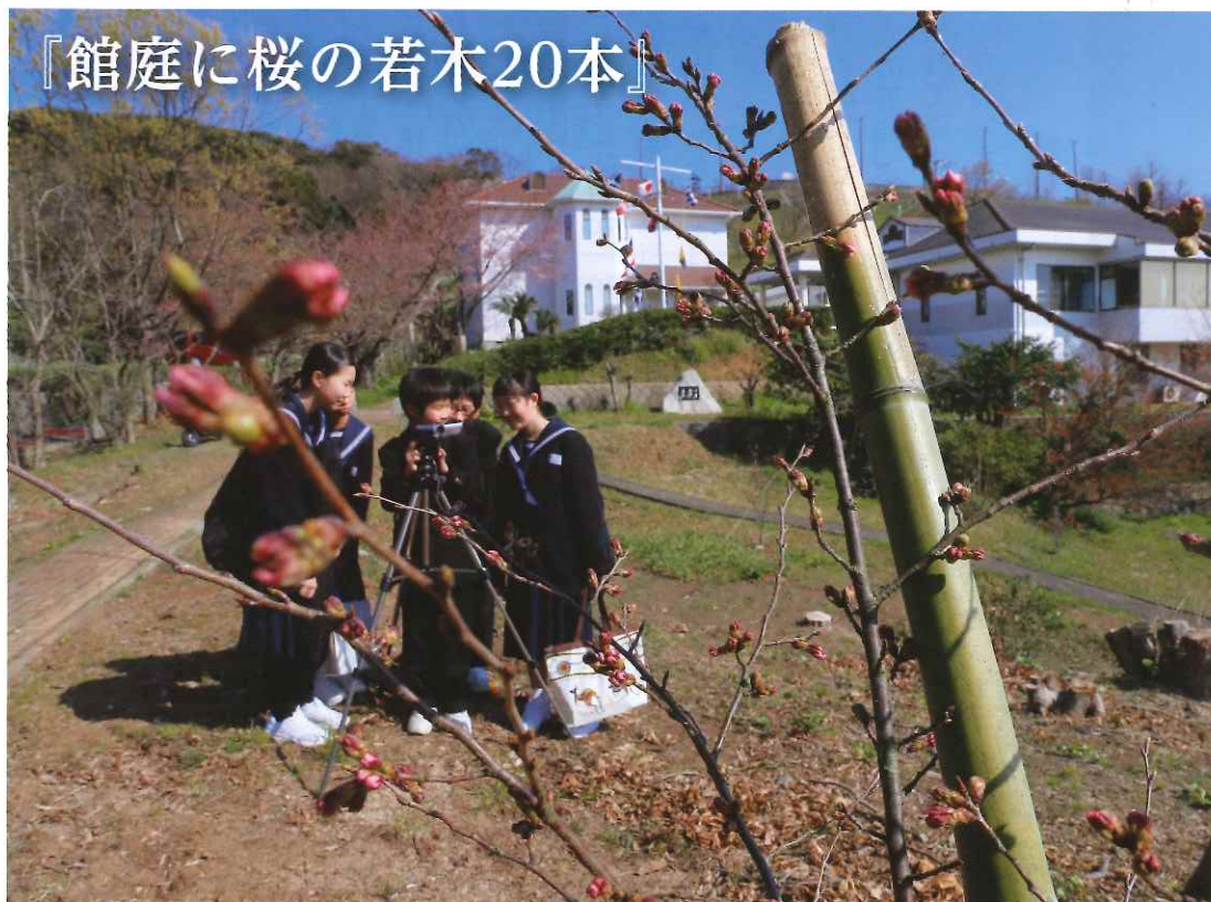
『館庭に桜の若木20本』