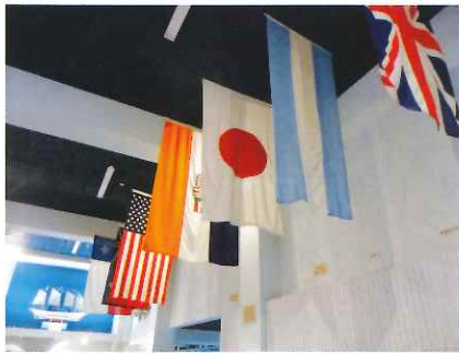
南極探検参加国を示す日章旗 開南丸の模型もあった

留学生など日本人28人を含む185人が犠牲になったニュージーランド・クライストチャーチの地震から今年2月で5年目。市内のカンタベリー博物館(1867年創立)で、日本に関する思いがけない常設展示に出会いました。自国の文化・歴史だけでなく世界に目配りする懐の深さ。「モナリザ」の画家ダビンチも、絵ではなく彼の万能にスポットを当て、発明家としての先見性に広いスペースを割いていました。これぞグローバル時代——。