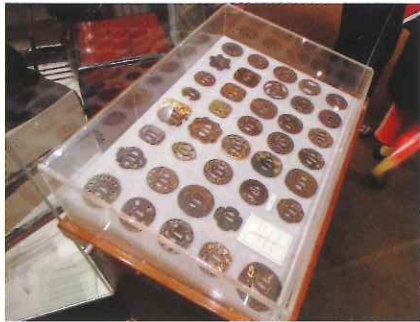
日本刀のつばコレクション