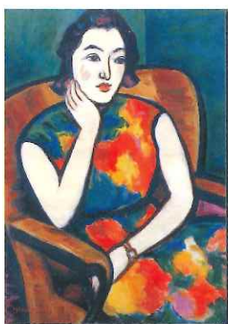
昭和39年作「青年座女優」