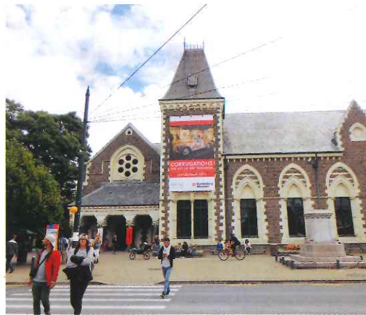
歴史的建造物の博物館全景