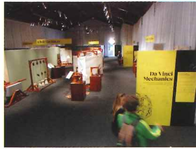
多彩なダビンチの業績に感動