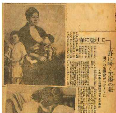
「上野に咲く美術の花」 四ツの風舞が、ついでに、 40年一世紀にわたる日本の美術史