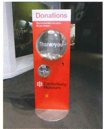
入場無料=入り口に寄付金入れ 同じ市内の美術館も無料だった