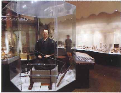
実物大のサムライ像にびっくり